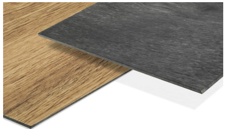
Abbildung 1: Synthetischer Bodenbelag

PVC ist ein bewährter Werkstoff für elastische Bodenbeläge, der aufgrund seiner technischen und wirtschaftlichen Eigenschaften weit verbreitet eingesetzt wird. Zu seinen Stärken zählen hohe Langlebigkeit, Wasserbeständigkeit sowie eine große gestalterische Flexibilität. Zudem ermöglicht PVC eine einfache Installation und ist in der Regel kostengünstig verfügbar. Auch im Brandfall zeigt der Werkstoff vorteilhafte Eigenschaften, da er nicht brandfördernd ist.