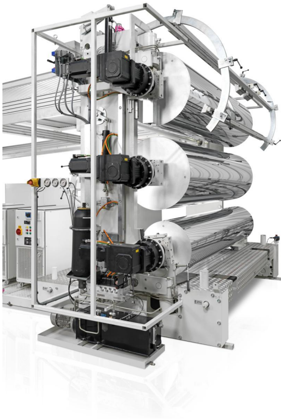
Abbildung 4: Kalandr Glättwerk für Plattenproduktion

Im Downstream-Bereich folgen die Abkühlung des Materials, der Kantenbeschnitt sowie der finale Zuschnitt auf die gewünschte Abmessung. Abschließend ermöglichen Verfahren wie Digitaldruck, Prägung und Beschichtung eine gezielte Ausgestaltung von Optik und Haptik, wodurch die funktionalen und gestalterischen Produkteigenschaften final definiert werden.