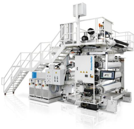
Abbildung 2: Glättwerk mit Laminierstation

Die Herstellung polyolefinbasierter Bodenbeläge erfolgt in mehreren aufeinander abgestimmten Prozessschritten, die eine gezielte Einstellung der Materialeigenschaften sowie der finalen Produktqualität ermöglichen. Der grundlegende Substitutionsansatz besteht darin, PVC in bestehenden Anwendungen durch polypropylenbasierte Compounds zu ersetzen, ohne die funktionalen Anforderungen an das Endprodukt wesentlich zu verändern. Im Rahmen eines Entwicklungsprojekts wurden insgesamt 15 unterschiedliche Rezepturen entwickelt und untersucht, wobei ein Dickenbereich von 2,5 mm bis 5 mm betrachtet wurde.